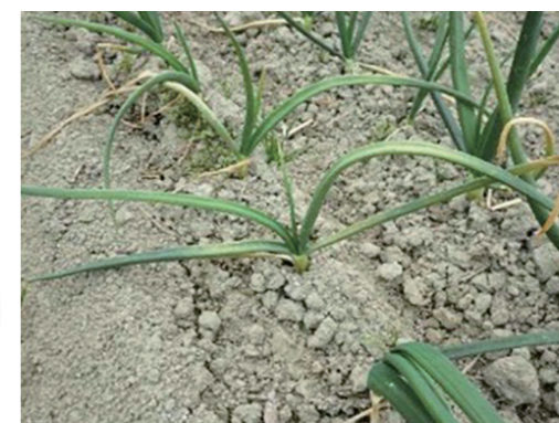
タマネギベと病全身感染株